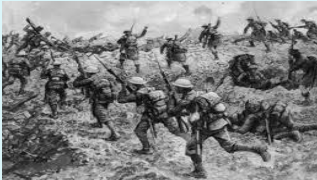
Autorem materiálu a všech jeho částí, není-li uvedeno jinak, je Mgr. Věra Fiřtová. Financováno z ESF a státního rozpočtu ČR.