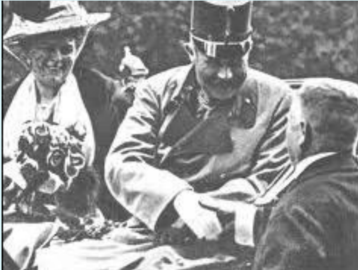
František Ferdinand d'Este s manželkou Žofií při návštěvě Sarajeva